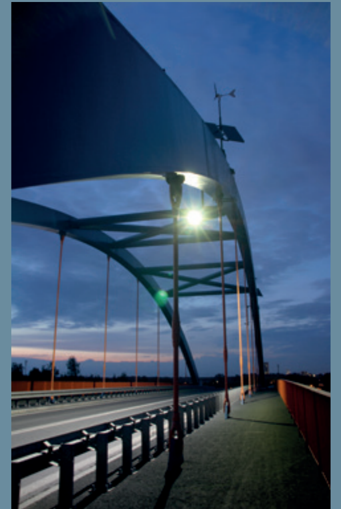
lampa hybrydowa solarno-wiatrowa SOWA