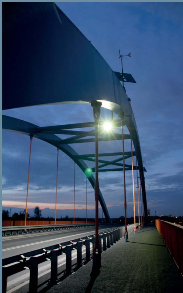
lampa hybrydowa solarno-wiatrowa SOWA