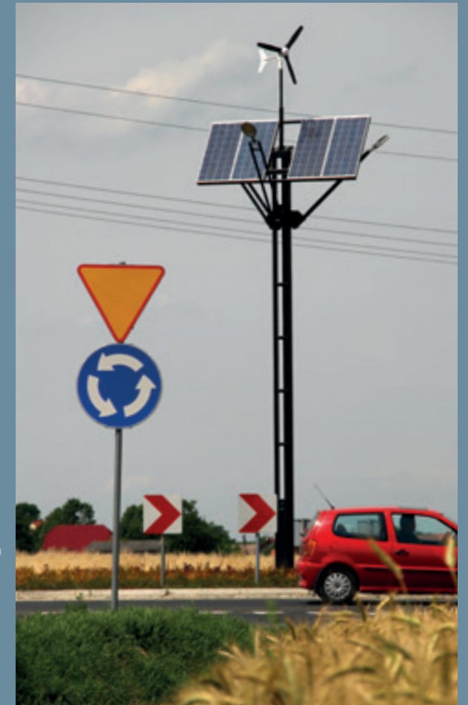
lampa hybrydowa solarno-wiatrowa RONDO