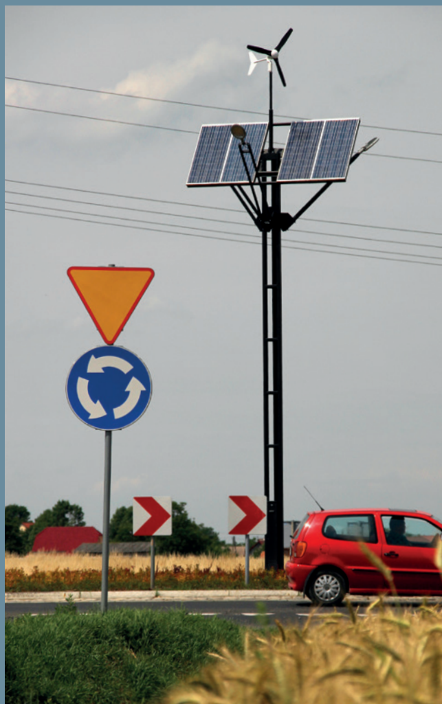
lampa hybrydowa solarno-wiatrowa RONDO