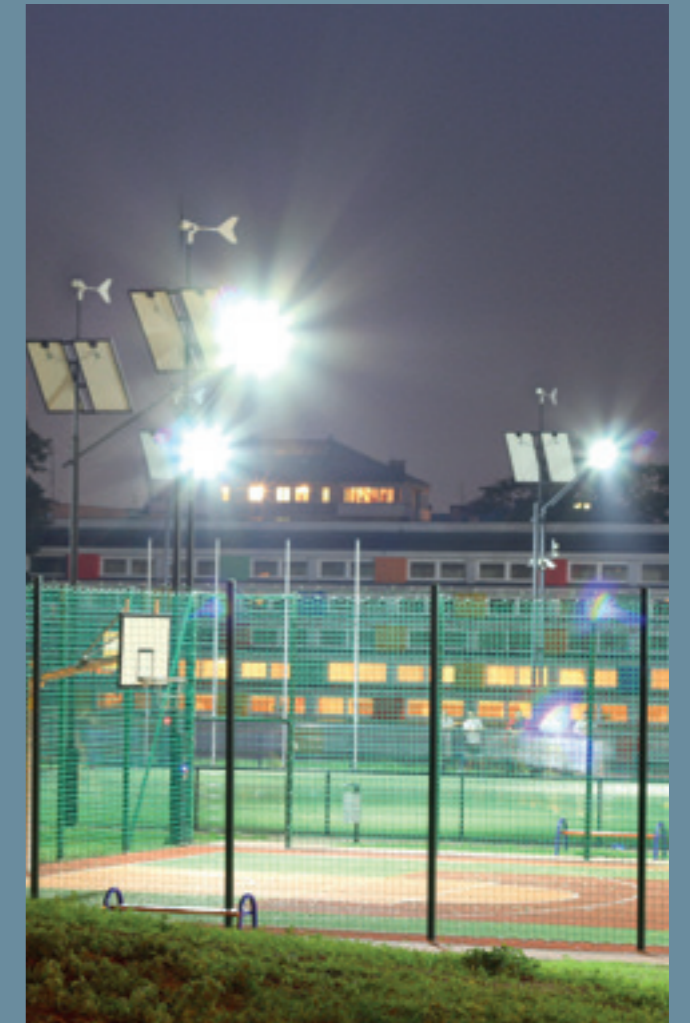
lampa hybrydowa solarno-wiatrowa CZAPLA Sport