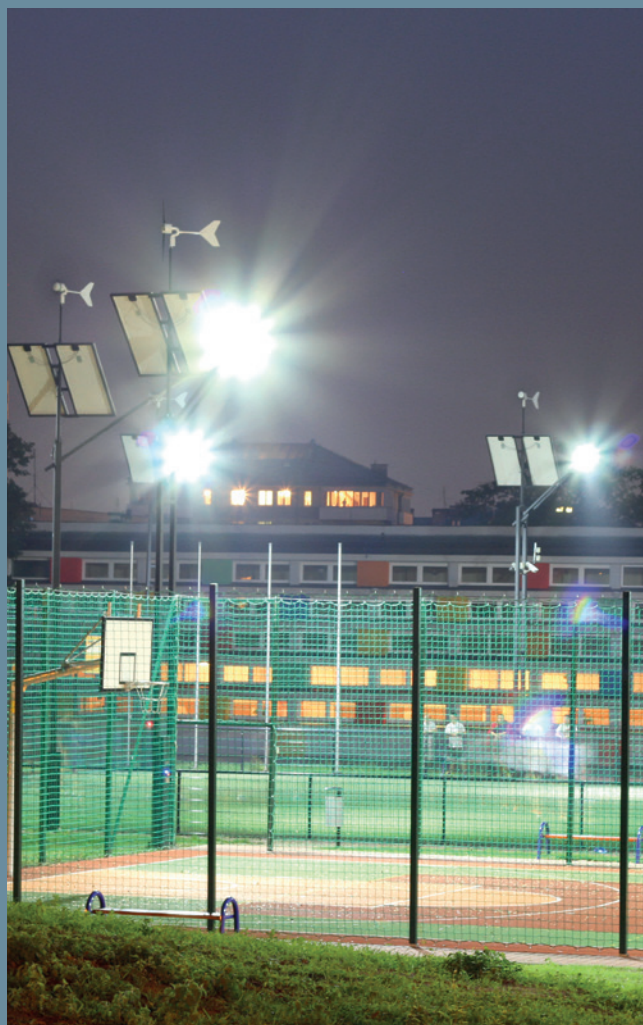
lampa hybrydowa solarno-wiatrowa CZAPLA Sport