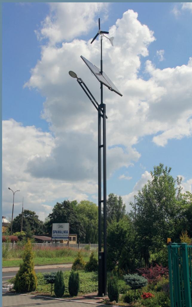
lampa hybrydowa solarno-wiatrowa CZAPLA