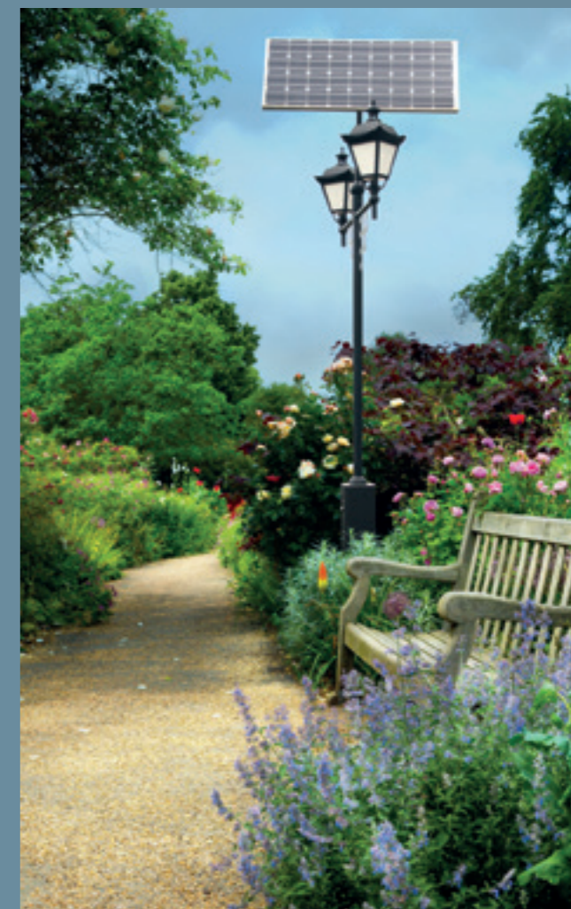
lampa solarna BRATEK Retro