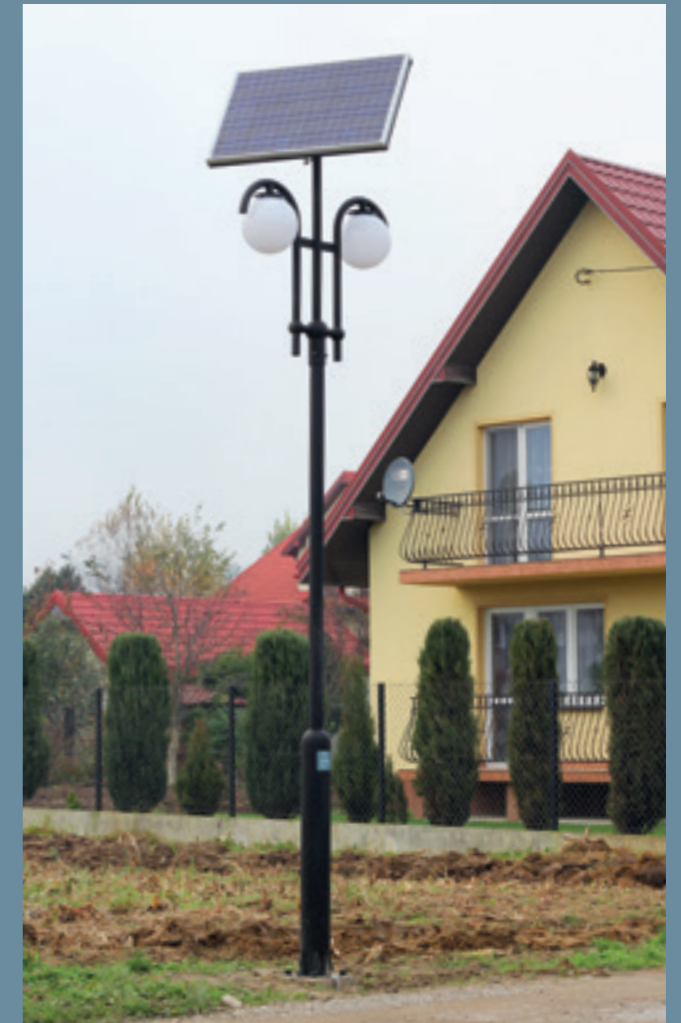
lampa solarna BRATEK Eco