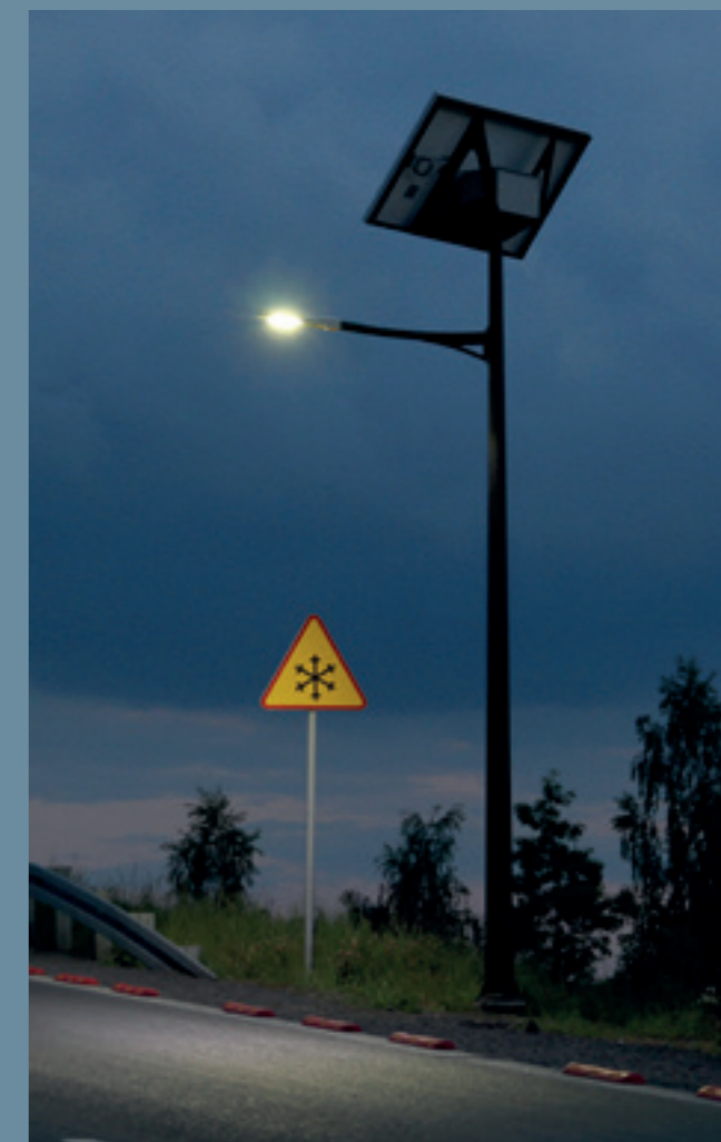
lampa solarna BOCIAN